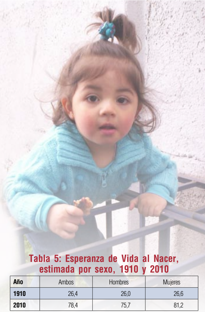
Tabla 5: Esperanza de Vida al Nacer, estimada por sexo, 1910 y 2010

Por otro lado, el nivel de mortalidad de la población, medido a través de la Esperanza de Vida al Nacer (EVN) y que expresa el número promedio de años que, se espera, pueda vivir un recién nacido (Tabla 5), también varió considerablemente en el último siglo, pasando de 26 a 76 años en los hombres y de 27 a 81 años en las mujeres, un aumento aproximado de 50 y 55 años, respectivamente, debido a la mejora en la calidad de vida de la población (alimentación, salud, tecnología, entre los factores más relevantes).